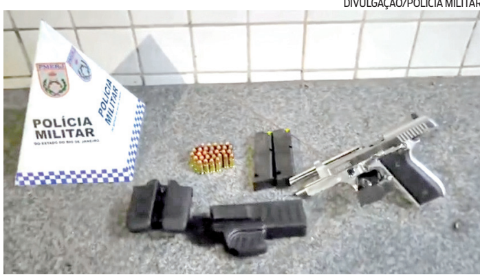
Com o impostor foram achadas armas, carregadores e munições